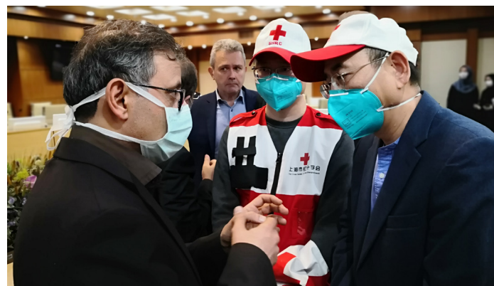
中国疾控中心专家在伊朗指导当地疫情防控。

塞拉利昂时间2020年3月31日凌晨2时,专家组在塞拉利昂—中国友好固定生物安全三级实验室(JUI P3实验室)检测发现了塞拉利昂首例新冠肺炎感染病例。截至4月底,实验室已检测657例新冠疑似病例,检测任务量占塞拉利昂国内一半以上。专家组还参加30余次塞拉利昂卫生部、世界卫生组织和世界银行等组织召开的新冠肺炎疫情防控专题会议,借助各种交流平台宣传中国抗疫经验,参与塞拉利昂防控新冠肺炎相关策略和技术方案制定,积极为该国整体防控工作建言献策。