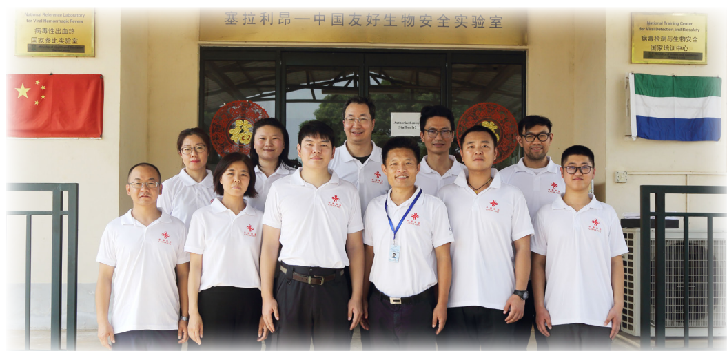
中国援助塞拉利昂专家合影。