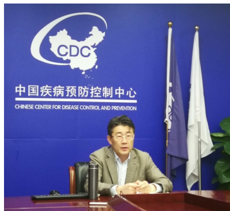
中国疾控中心主任高福参加并主持中国和美国科学院新冠肺炎疫情科学防控视频交流会。

中国疾病预防控制中心(简称“中国疾控中心”)在全力做好国内防控工作的同时,积极参与全球卫生治理,分享中国疫情进展和经验,助力全球新冠肺炎疫情防控。中国疾控中心与超过20个国家公共卫生机构和区域合作网络分享疫情信息、风险评估报告以及技术方案等;组织专家通过视频会议的形式与各国技术部门开展新冠肺炎疫情技术交流;与美国、韩国、法国等国家疾控中心启动主任热线电话机制,及时沟通信息,助力决策;参加国家卫生健康委与世界卫生组织驻华代表处的机制性会议和专家考察组工作,为阻止疫情在全球蔓延积极贡献力量,保护人类健康。