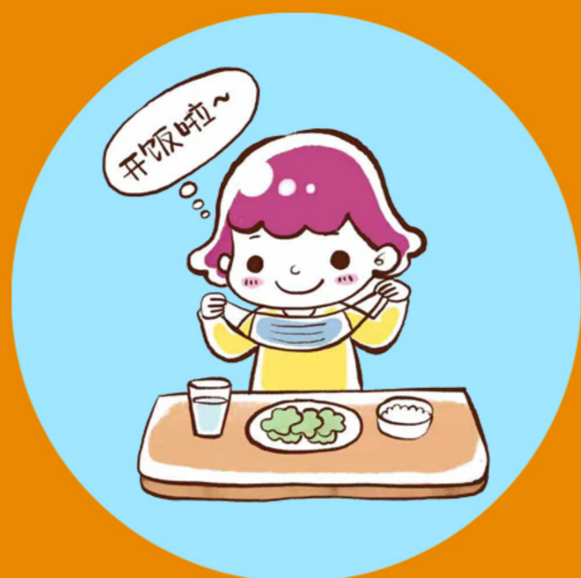
开始吃饭 才能摘口罩