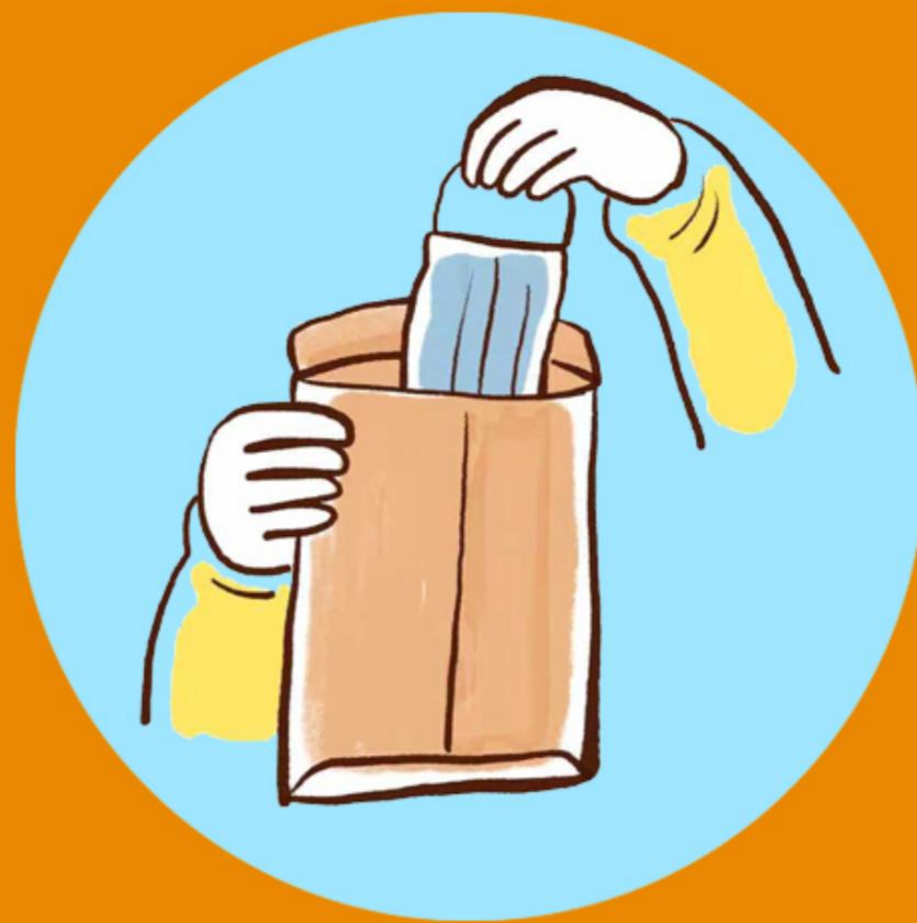
可重复使用的口罩 放入干净信封内