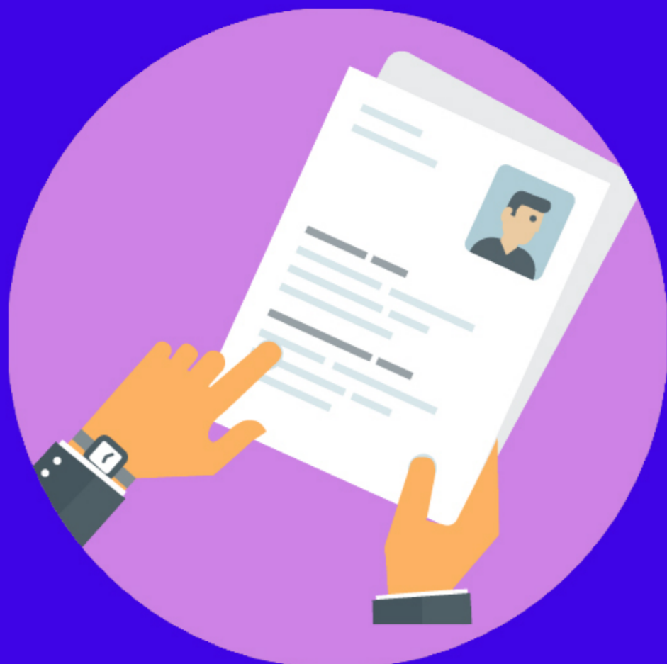
传递文件前后 均需洗手