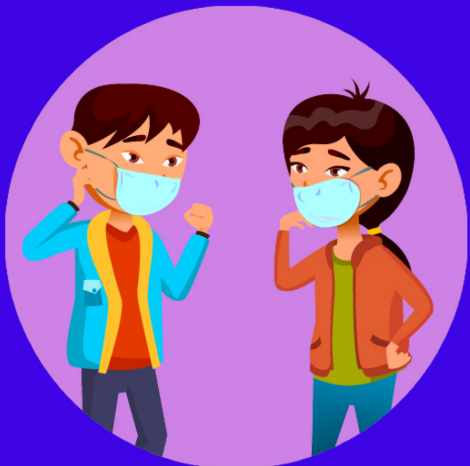
交谈时，双方 戴口罩