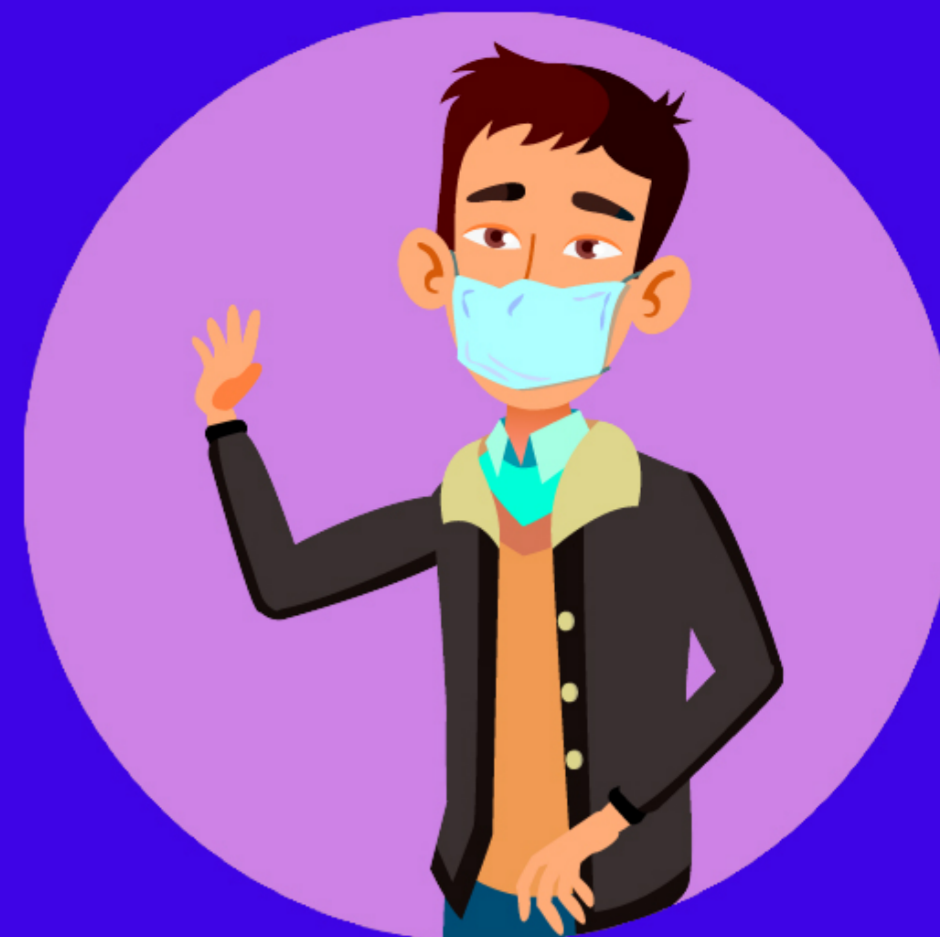
不要握手 微笑致意